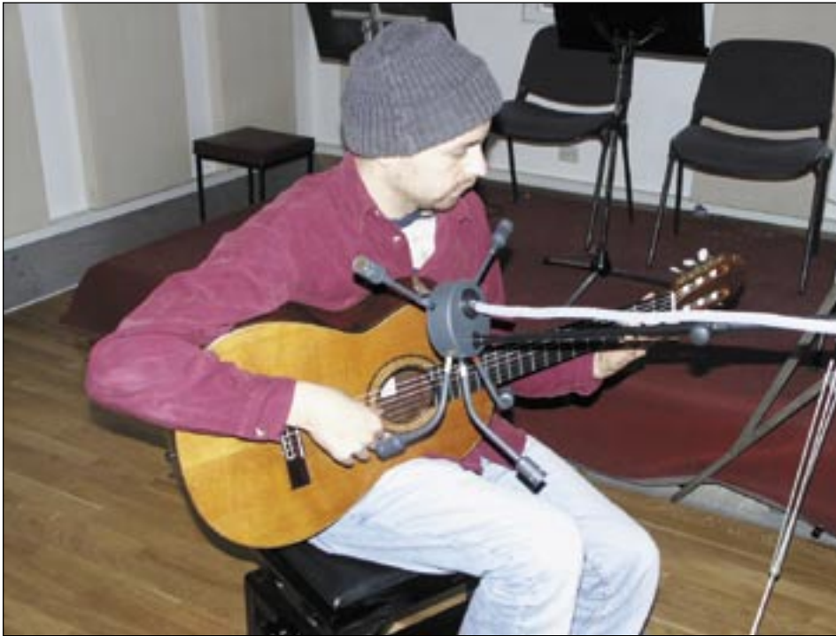
Akustik-Gitarren-Aufnahme mit Neumann-Spinne

1. Die Musiker im Halbkreis aufzustellen, um die Hörposition eines Zuhörers zu vermitteln.