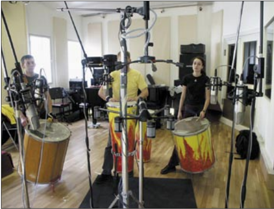
Mikrofon-Setup für das Samba Trommel-Ensemble ‚Bloko Explosau‘