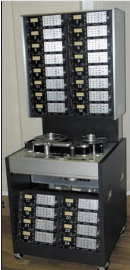
Tatsächlich Vergangenheit? Die gute alte Studer A80 24-Spur

Mit den DVD-Standards wurden 192 kHz als neue Hi-End-Abtastrate definiert. Unsere noch recht neuen Testkandidaten, die diese Abtastrate unterstützen, waren der Digidesign HD 192 und der Kuhnle 8192 in PCM Technologie. Beim Bestimmen des klanglichen Unterschiedes verschiedener Auflösungen zwischen älteren und den neuen 192 kHz Wandlern machten wir sofort eine überraschende Feststellung: die Plastizität der neuen, unabhängig von der Abtastrate, war so überragend, dass man im Blindtest jedes dieser Geräte ohne Mühe auseinander halten konnte. Im Vergleich zu den neuen Wandlertypen ‚klatschte‘ einem der Sound der alten Systeme förmlich ins Gesicht. Durch die flache Zweidimensionalität war etwas vom Originalklang verloren gegangen. Kein Wunder, dass sich die digitale Technik den Ruf als ‚Hartmacher‘ gefal-