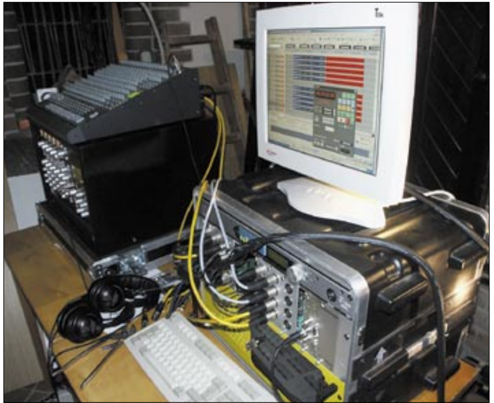
Setup für die Kirchaufnahme mit Atmos-Controller und Kuhnle AD 8192

Enge Mikrofonplatzierungen, wie Stereotechniken sie vorschreiben, sind meiner Meinung nach unter dem Surround-Gesichtspunkt ungeeignet. Manchem wird es schwer fallen, sich von den typischen A/B-Anordnungen zu lösen, realisiert zum Beispiel mit der MAB 1000 Schiene von Schoeps. Das wirkliche Potential der Surround-Mikrofonierung liegt in der Vorstellungsgabe des Toningenieurs. Das muss erst einmal begriffen werden.