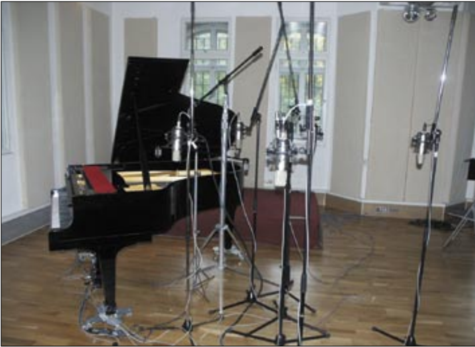
Mikrofon-Setup für eine Flügel-Surround-Aufnahme mit Rode NT 1000 auf Einzelstativen und zwei Surround-Spinnen

mikrofone wegen ihres schlechteren Impulsverhaltens nicht einsetzen. Bei Stereo- und Surround-Aufnahmen werden zur besseren Tiefenwiedergabe zusätzlich Kugelmikrofone eingesetzt – für eine klassische Herangehensweise sicherlich der puristischste Weg. Leider vermindern diese Mikrofone aber auch die Lokalisation. Kugelmikrofone erzeugen eine, nicht immer erwünschte, Tiefendimensionalität. Besonders modernere Produktionen brauchen druckvolle Nähe, dafür eignet sich der Nahbesprechungseffekt der Großmembran-Nieren besser. Die Brauner-Mikrofone bieten frei durchstimbare Richtcharakteristiken von Kugel bis Acht. Die Kugelstellung ist nur im Freien oder in großen Hallen zur besseren Darstellung der Tiefendimensionen sinnvoll. In kleineren Räumen ist diese Einstellung wirkungslos und durch den Verlust der Lokalisation eher nachteilig.