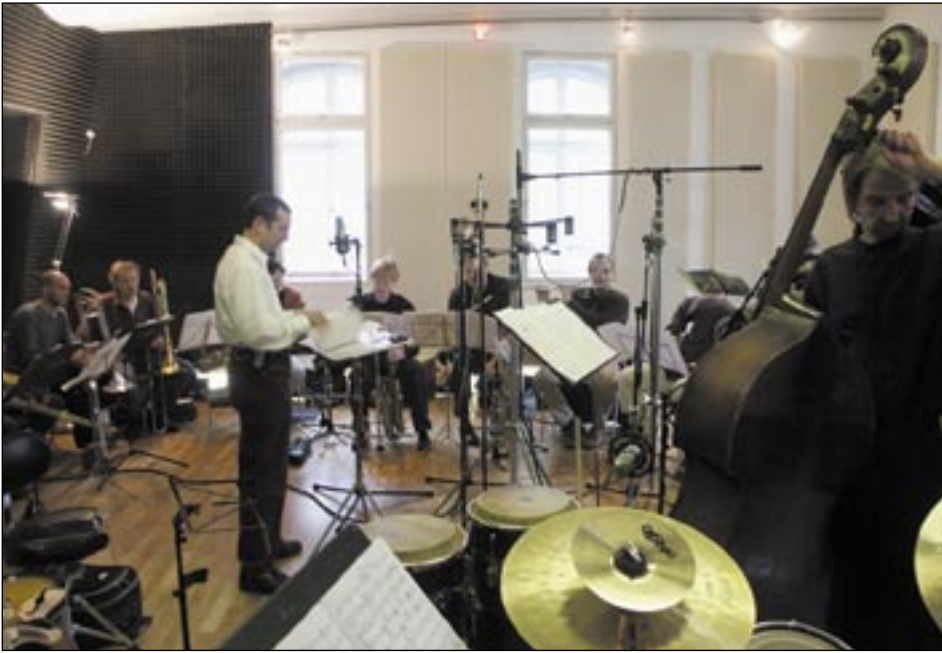
Bigband-Surround-Aufnahme mit zwei Spinnen und Stützmikrofonen